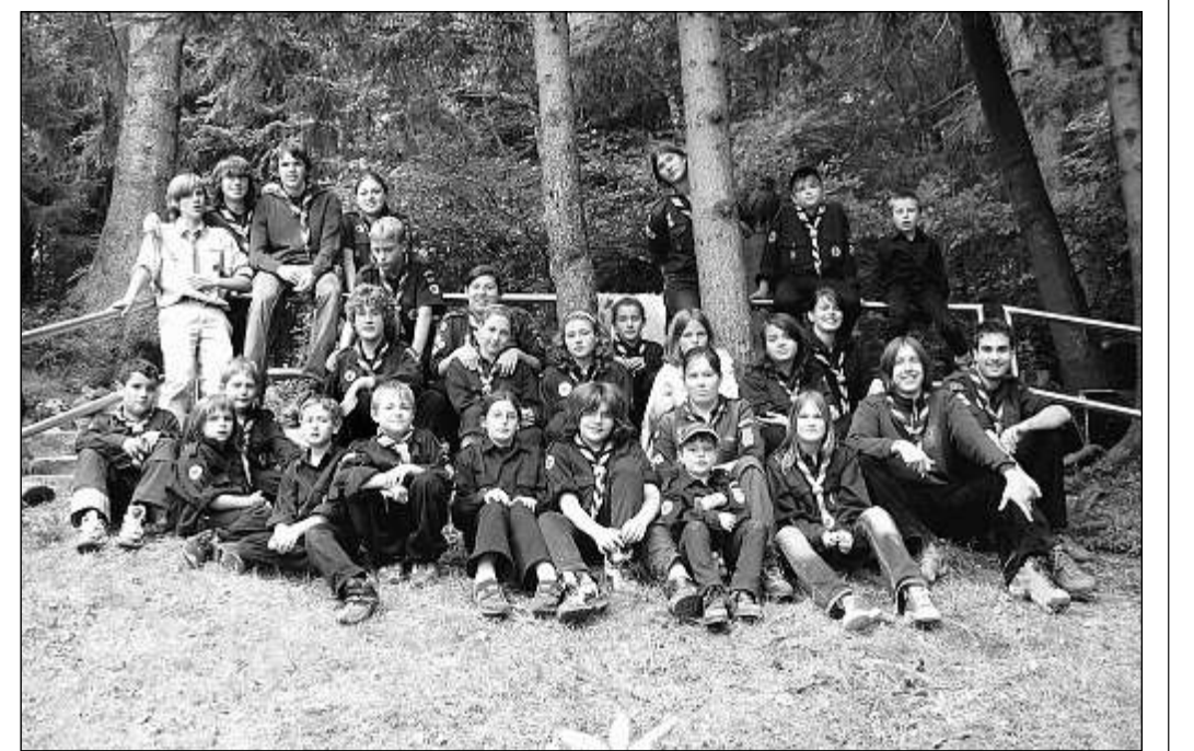
VIELE AUFGABEN hatten die beiden Stämme des Pfadfinderbundes Weltenbummler bei ihrem Aufenthalt im Orgelfelsenhaus, der unter dem Motto „Robinson Crusoe“ stand, zu erfüllen.

Das Spielmobil nennt folgende Termine: 30. Juli bis 2. August Michelbach bei der Wiesenthalhalle; 6. bis 9. August Waldseebad; 13. bis 16. August Spielplatz im Kurpark Rotenfels; 20. bis 23. August Schwimmbad Ottenau; 27. bis 30. August Spielplatz beim Sportplatz in Hörden; 3. bis 6. September Oberweier.