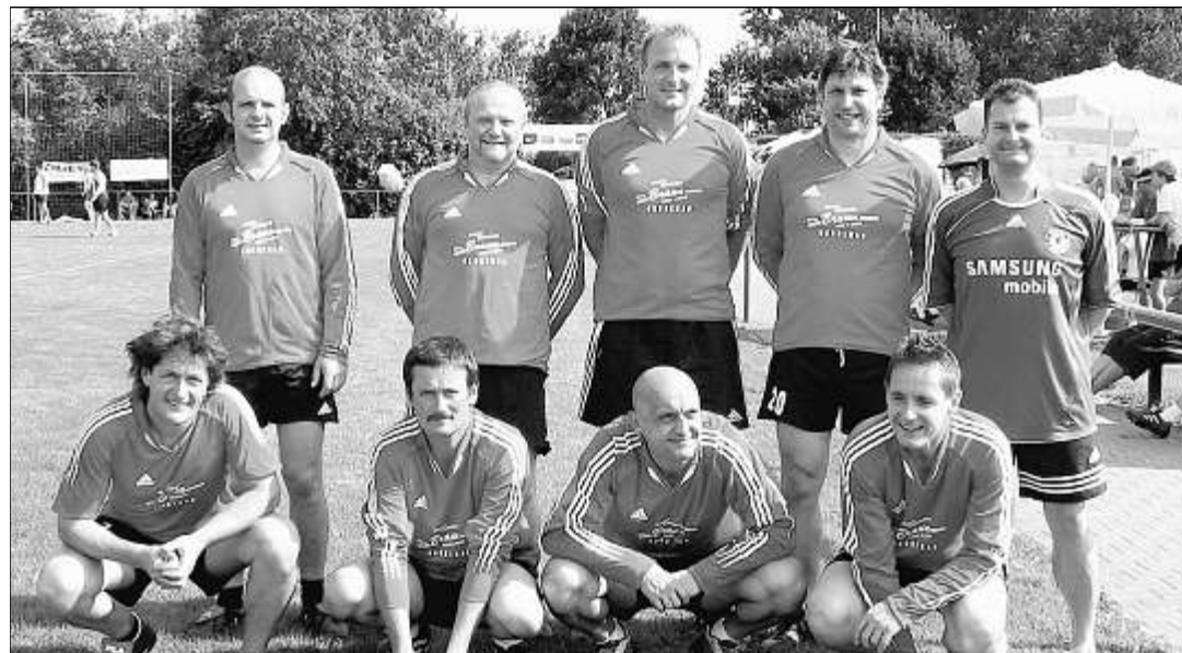
MIT SEINEN DRITTEN PLATZ bei den westdeutschen Meisterschaften hat das Team Männer 35 des TV Oberweier die Qualifikation für die deutsche Meisterschaft geschafft.